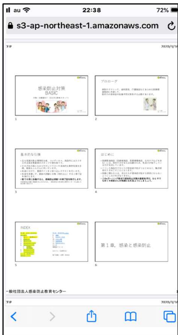
1 ページ 6 スライド配布資料 計 A4 19 枚

【テキスト】1 ページ 2 スライド配布資料 計 A4 57 枚 (枚数多いです)