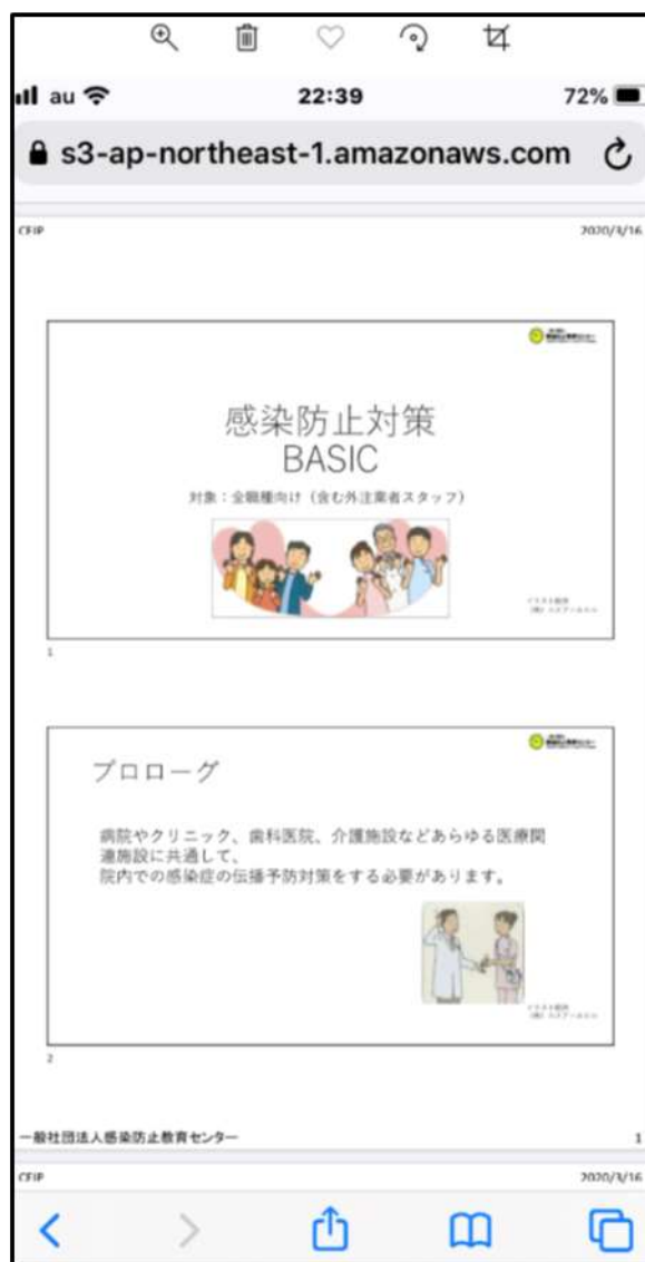
1 ページ 2 スライド配布資料 計 A4 57 枚 (枚数多いです)